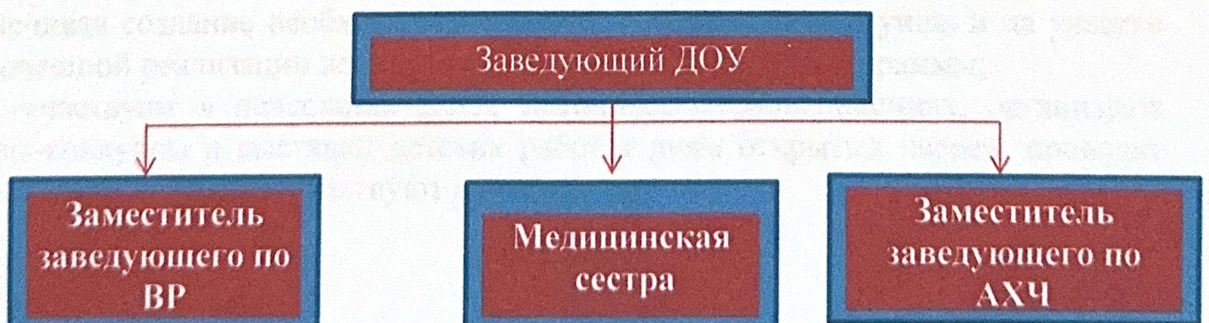
Схема. II направление — административное управление

В состав родительского собрания входят все родители (законные представители) обучающихся, посещающих ДООУ. Полномочия, структура, порядок формирования и порядок деятельности Общего родительского собрания устанавливаются локальным актом ДООУ. Общее родительское собрание действует по плану, входящему в годовой план работы ДООУ. Общее родительское собрание собирается не реже 2 раз в год.